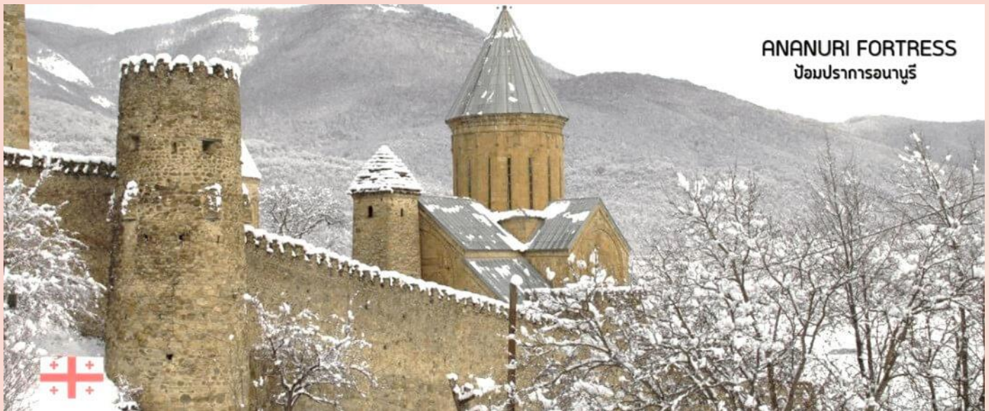
ANANURI FORTRESS ป้อมปราการอนานูรี

ชินวาลี (ZHINVALI RESERVOIR) และยังมีเขื่อนซึ่งเป็นสถานที่ที่สำคัญสำหรับนำน้ำที่เก็บไว้ส่งต่อไปยังเมืองหลวง พร้อมใช้ผลิตกระแสไฟฟ้า ที่ทำให้ชาวเมืองทบิลิซีมีน้ำไว้ดื่มใช้ (ใช้เวลาเดินทางประมาณ 1.10 ชั่วโมง)