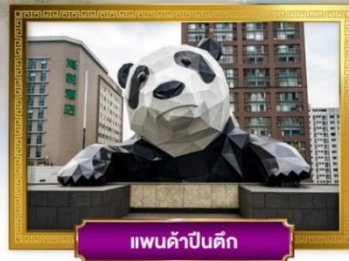
แพนด้าป็นตึก