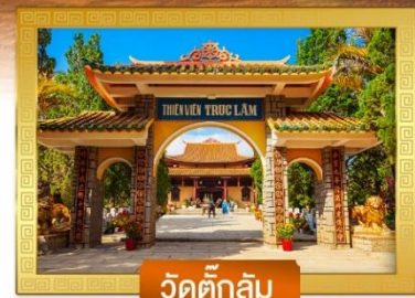
วัดด๊กลิ้ม