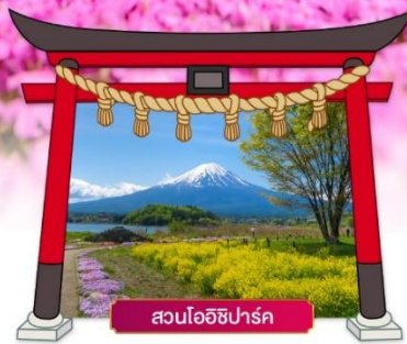
สวนโออิชิปาร์ค