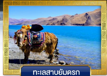
ทะเลสาบยัมดรก

เดินทางโดย: สายการบินบลัดก็แอร์ & ไซน่าอีสเทิร์นแอร์ไลน์ อาหาร : 17 มื้อ โรงแรม : 4 ดาว