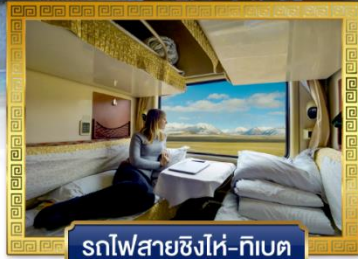
รถไฟสายชิงไห่-ทิเบต