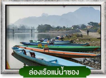
ล่องเรือแม่น้ำซอง