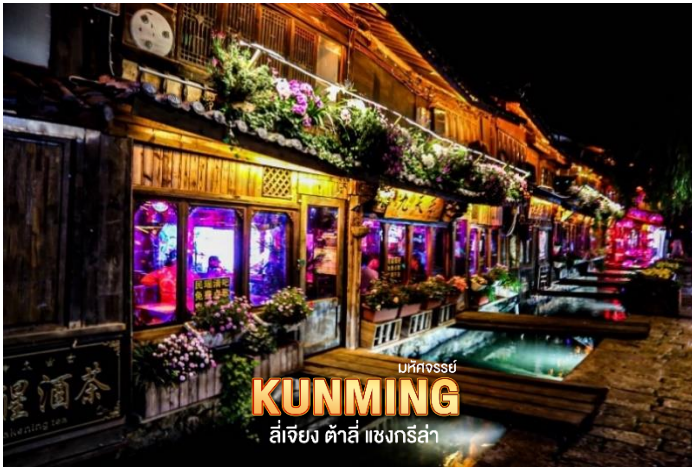
บหคทอสย์ KUNMING ลี่เจียง ดาลี แซงกรีสล่า