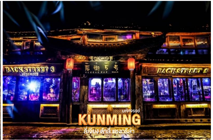
บหคทอสย์ KUNMING ลี่เจียง ดาลี แซงกรีสล่า