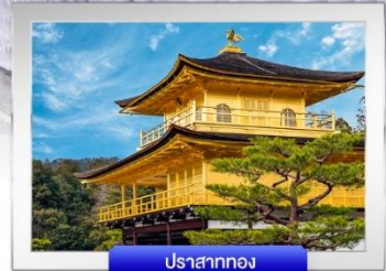
ปราสาททอง