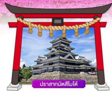
ปราสาทมัตสึโมโต้