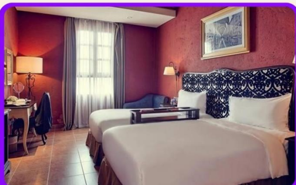
พักนบนาฮิลล์ 1 คืน