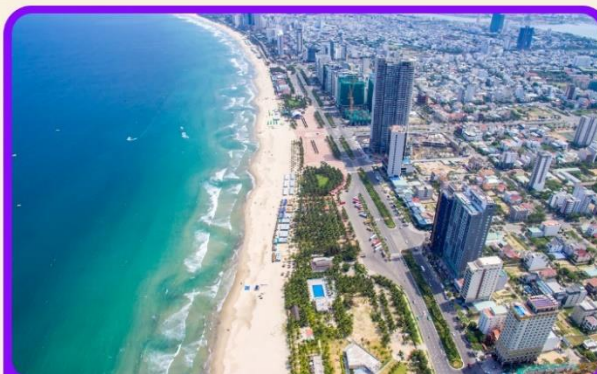
เซ็คอิน ชายหาดหมีคว เป็นชายหาดที่สวยงามที่สุดในเมืองดานัง