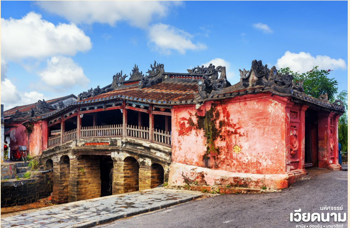
มัทศจรรย เวียดนาม ดานัง • ฮอยอัน • บานาฮิลล์

สร้างโดยชุมชนชาวญี่ปุ่นเมื่อ 400 กว่าปีมาแล้ว กลางสะพานมีศาลเจ้าศักดิ์สิทธิ์ ที่สร้างขึ้นเพื่อ สวดส่งวิญญาณมังกร ชาวญี่ปุ่นเชื่อว่า มีมังกรอยู่ใต้พิภพส่วนตัวอยู่ที่อินเดียและหางอยู่ที่ญี่ปุ่น ส่วนลำตัวอยู่ที่เวียดนาม เมื่อใดที่มังกรพลิกตัวจะเกิดน้ำท่วมหรือแผ่นดินไหว ชาวญี่ปุ่นจึงสร้าง สะพานนี้โดยตอกเสาเข็มลงกลางลำตัวเพื่อกำจัดมันจะได้ไม่เกิดภัยพิบัติขึ้นอีก ชม ศาลกวางอู ซึ่งอยู่ บนสะพาน ญี่ปุ่นและที่ฮอยอันชาวบ้านจะนำสินค้าต่าง ๆ ไว้ที่หน้าบ้าน เพื่อขายให้แก่นักท่องเที่ยว ท่านสามารถซื้อของที่ระลึก เป็นของฝากกลับบ้านได้อีกด้วย เช่น กระเป๋าโคมไฟ เป็นต้น