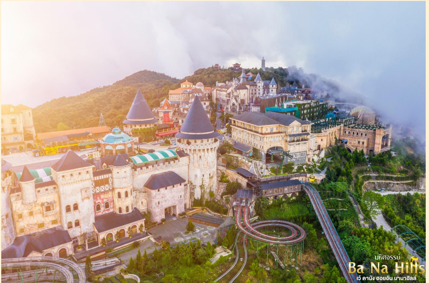
มหัศจรรย์ Ba Na Hills เว้ ดานัง ฮอยอัน บานาฮิลล์