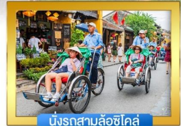
นั่งรถสามล้อซีโคล์