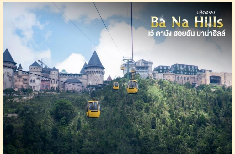
มหัศจรรย์ Ba Na Hills เว้ ดานัง ฮอยอัน บานาฮิลล์

กระเช้าแห่งบานาฮิลล์นี้ได้รับการบันทึกสถิติโลกโดยWorld Record ว่าเป็นกระเช้าไฟฟ้าที่ยาวที่สุดประเภท Non Stop โดยไม่หยุดแะมีความยาวทั้งสิ้น 5,042 เมตรและเป็นกระเช้าที่สูงที่สุดที่ 1,294 เมตรนักท่องเที่ยวจะได้สัมผัสปุยมะหมอกและบางจุดมี