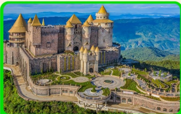
เที่ยวบานาฮิลล์แบบจุใจ เต็มวัน