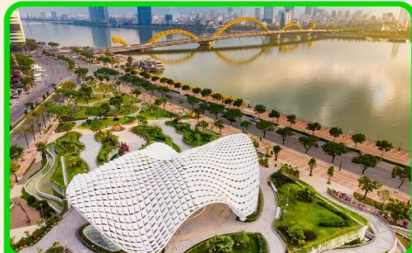
เช็किन แหล่งที่เที่ยงใหม่ APEC PARK