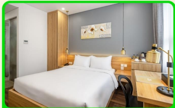
พักเมืองดานัง 4 ดาว 3 คืน