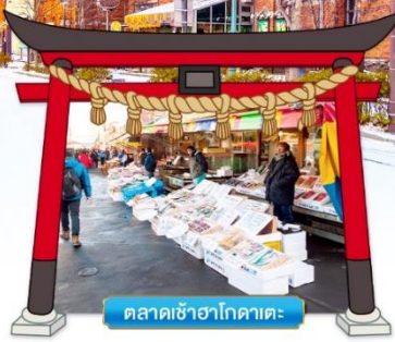
ตลาดเช้าฮาโกดาเตะ