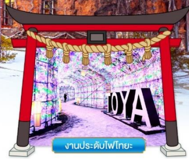
งานประดับไฟโทโยะ

พิเศษ! บุฟเฟ่ต์ชาบูยักษ์ 3 ชนิด, แช่น้ำแร่ออนเซน