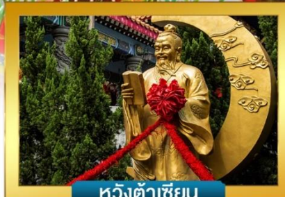
หวังต้าเซียน