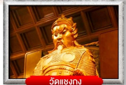
วัดเซ่งกง

บินหรู สายการบิน Full Service อาหาร : 4 มื้อ โรงแรม : 4 ดาว