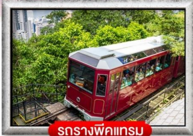
รถรางพิกไทรม