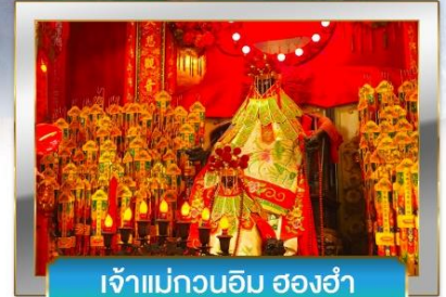
เจ้าแม่กวนอิม ฮองฮำ