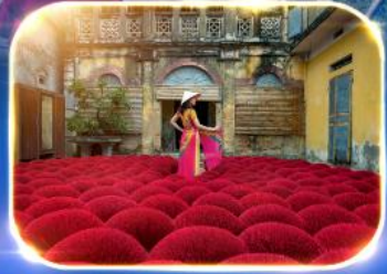
หมู่บ้านธูป Incense Village

สุดฟิน!! ฟรีเชียม บุฟเฟ่ต์ปิ้งย่างสไตล์ญี่ปุ่น