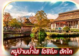
หมู่บ้านน้ำใส โอชิโนะ ฮักโก