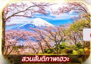
สวนสันติภาพเอวะ