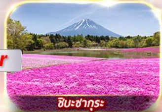
ชิบะซากุระ