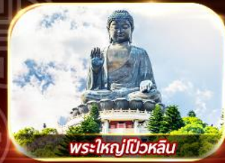
พระใหญ่โป้วหลิน