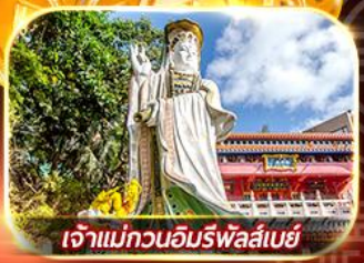
เจ้าแม่กวนอิมริพัลส์เบย์