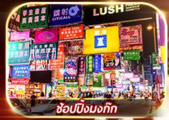
ช้อปปิ้งมงก๊ก

ร่วมพิธีเปิดท้องพระคลังยืมเงินเจ้าแม่กวนอิม 1 ปีมีครั้งเดียว