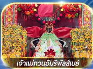
เจ้าแม่ทวนอิมรีฟลส์เบย์