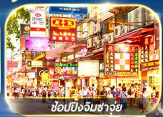
ช้อปปิ้งจิมซาจุย

เต็มอิ่มทั้ง ไหว้พระ-ขอพร และ ซ้อปปิ้งแบบจัดเต็ม