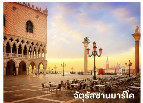
จัตุรัสซานมาร์โค

ท่านสามารถทำการสแกน QR CODE นี้ เพื่อรับชม เกาะเวนิส ในรูปแบบวิดีโอ