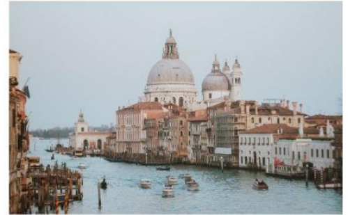
แกรนด์คาแนล

นำทุกท่านนั่งเรือต่อเพื่อไปยัง ท่าเรือซานมาร์โค (San Marco Pier) บนเกาะเวนิส