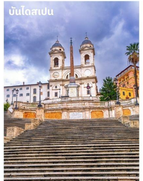
บันไดสเปน