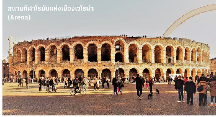
สนามกีฬาโรมันแห่งเมืองเวโรน่า (Arena)