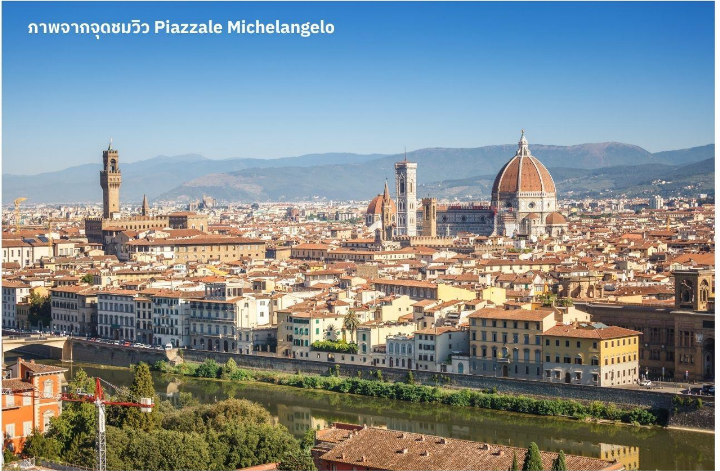
ภาพจากจุดชมวิว Piazzale Michelangelo

เมืองฟลอเรนซ์ ตั้งอยู่ทางตอนเหนือของประเทศอิตาลี เป็นเมืองที่มีชื่อเสียงในช่วงศตวรรษที่ 13-14 ซึ่งเป็นยุคที่เจริญรุ่งเรืองของวัฒนธรรมและศิลปะ อีกทั้งในอดีตยังมีความสำคัญทางการค้าและวัฒนธรรม มีสถาปัตยกรรมที่งดงามและเป็นที่มาของศิลปะโรแมนติกที่เจริญรุ่งเรืองอย่างมากในยุคนั้น นำท่านเดินทางไปยังเนินเขา Piazzale Michelangelo เพื่อชมวิวของเมือง Florence ที่นักท่องเที่ยวรวมไปถึงชาว Florence เอง มักขึ้นมาชมบรรยากาศในมุมสูงของเมือง ซึ่งจะเห็นหลังคาสีแดงของอาคารบ้านเรือนต่างๆ รวมไปถึง Duomo เรียงรายกันเป็นแนวสวยงามยิ่งนัก อีสาระให้ท่านเก็บภาพประทับใจตามอัธยาศัย