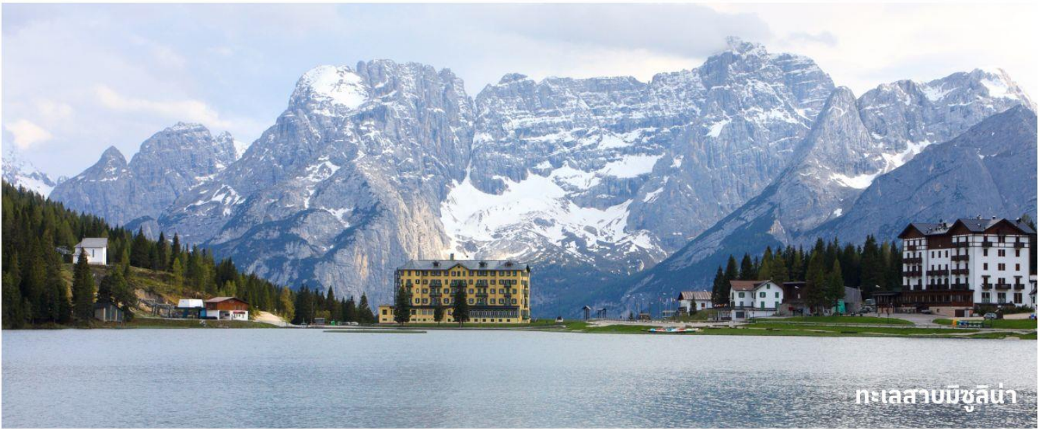
ทะเลสาบมิซูลิน่า

นำท่านเดินทางสู่ที่ ทะเลสาบมิซูลิน่า (MISURINA LAKE) ถ่ายรูปกับทะเลสาบที่สวยงามและเป็นเหมือนกับหนึ่งในแลนด์มาร์คที่นักท่องเที่ยวต้องมาเยือนสักครั้งหนึ่ง เป็นทะเลสาบที่หลบซ่อนตัวในหุบเขา ที่ถือเป็นสถานที่ท่องเที่ยวที่สำคัญอีกแห่งในโดโลไมท์