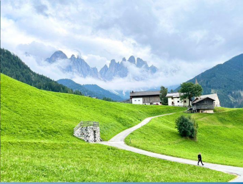
Santa Maddalena - Val di Funes