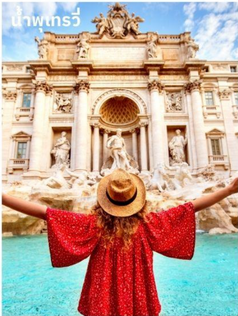
น้ำพุเทรวี

จากนั้นอิสระตามอัธยาศัยกับการเลือกซื้อสินค้าแฟชั่นและของที่ระลึกในบริเวณย่าน บันไดสเปน (The Spanish Step) ซึ่งเป็นแหล่งแฟชั่นชั้นนำสุดหรูและยังเป็นแหล่งนัดพบของชาวอิตาเลียน