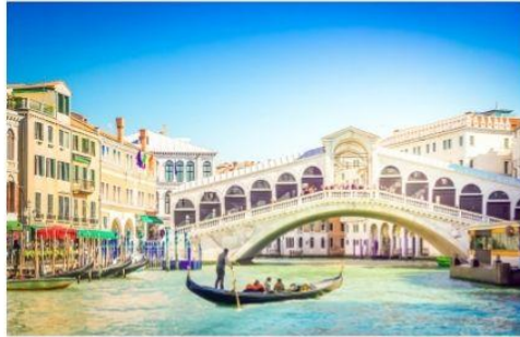
สะพานริอัลโต