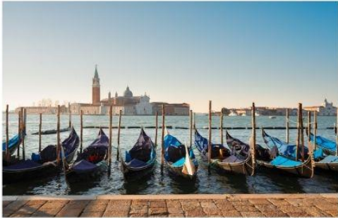
เรือกอนโดลา

นำท่านออกเดินทางสู่ ท่าเรือตรอนเคโตโต้ เพื่อเตรียมตัวนั่งเรือข้ามสู่เกาะเวนิส เกาะเวนิสเป็นดินแดนแสนโรแมนติก เป็นเมืองที่ไม่เหมือนใคร โดยใช้เรือแทนรถ ใช้คลองแทนถนน มีสมญานามว่าเป็น “ราชินีแห่งทะเลเอเดรียติก” มีเกาะน้อยใหญ่กว่า 118 เกาะและมีสะพานเชื่อมถึงกัน กว่า 400 แห่ง