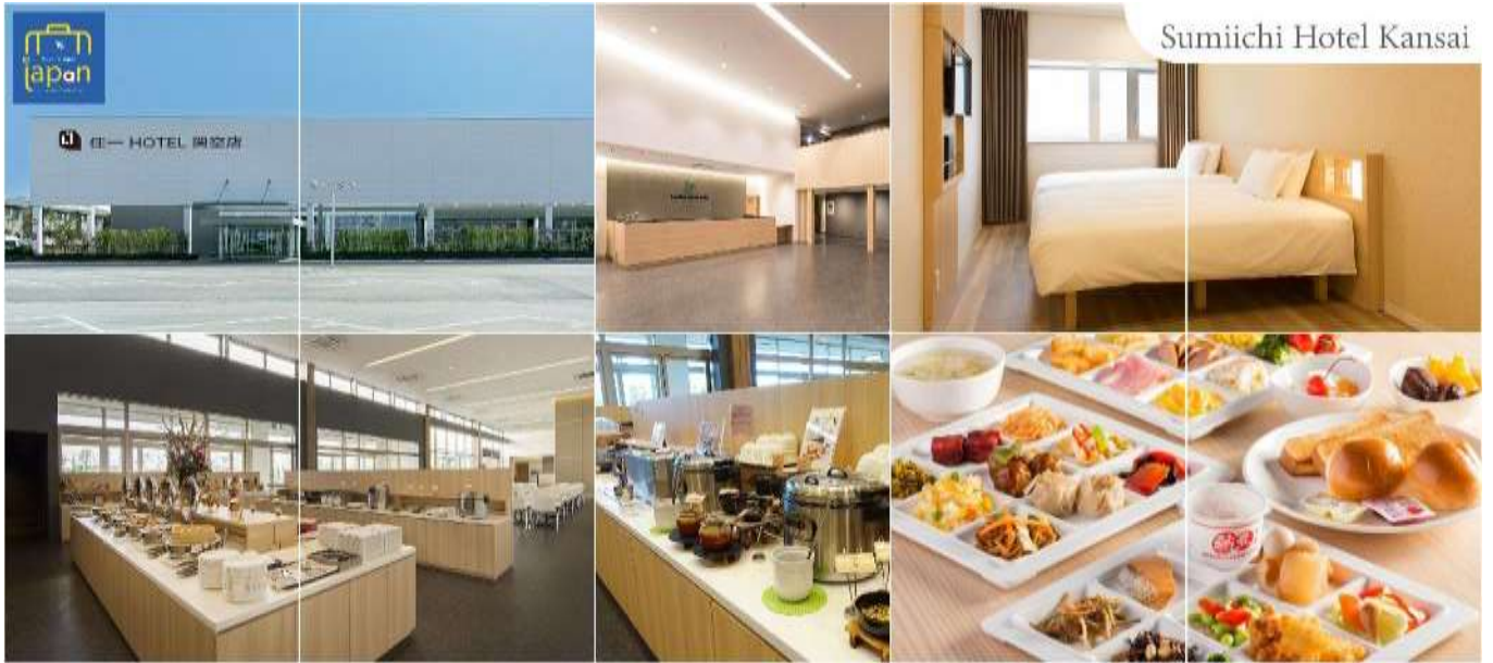
Sumiichi Hotel Kansai

วันที่สอง เมืองเกียวโต – วัดกินคะคุจิ หรือ วัดเงิน – ถนนสายนักปราชญ์ – การเรียนพิธีชงชาญี่ปุ่น – เมืองมิโนะ – วัดคัตสึโอะจิ – เมืองโอซาก้า – เอ็กซ์โปซิต์ (จุดชมซากุระชั้นกับภูมิอากาศ)