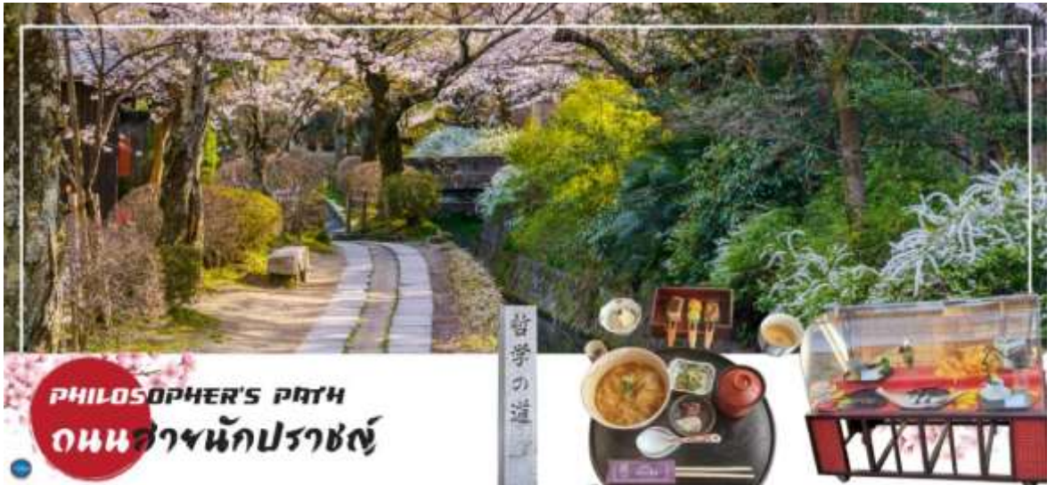
เที่ยง รับประทานอาหารกลางวัน ณ ภัตตาคาร (2)

บริเวณใกล้เคียงกันนำท่านเดินชม และช้อปปิ้ง ถนนสายนักปราชญ์ (Philosopher's Path) หรือ Tetsugaku no Michi เป็นถนนทางเดินเล็กๆ เลียบคลองส่งน้ำทะเลสาบบิวะ (Lake Biwa Canal (Biwako-sosui)) ตั้งอยู่ทางตะวันออกของเมืองเกียวโต (Kyoto) โดยเริ่มต้นตั้งแต่ใกล้ๆ กับวัดกินคะคุจิ (Ginkakuji Temple) ยาวมาจนถึงใกล้ๆ กับบริเวณวัดเอคันโด (Eikando Temple) และวัดนันเซ็นจิ (Nanzenji Temple) รวมเป็นระยะทางประมาณ 2 กิโลเมตร โดยตลอดเส้นทางนั้นก็เรียงรายไปด้วยต้นซากุระประมาณ 500 ต้น จึงเป็นจุดชมซากุระยอดนิยมในช่วงกลางเดือนมีนาคมถึงช่วงต้นเดือนเมษายน ( ขึ้นอยู่กับภูมิอากาศ ) และที่แห่งนี้ก็ยังมีร้านขายของและคาเฟ่น่ารักๆ กับน้องแมวที่อาจจะโผล่มาให้ท่านได้ถ่ายรูปอีกด้วย