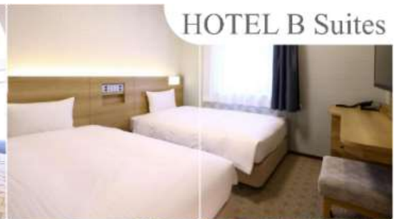
HOTEL B Suites