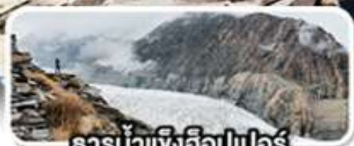
ธารน้ำแข็งอ็อปเปอร์