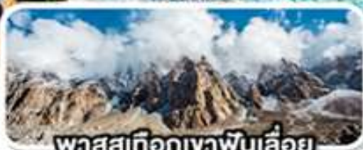
พาสสุเทือกเขาพินเลื่อย

เดินทาง 08-16 ก.พ. 68 (วันวาเลนไทน์, วันมาฆบูชา)