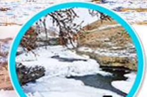
เดินเล่นบนธารน้ำแข็ง Orkhon river