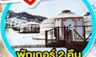
พักเกอร์ 2 คืน (มีห้องน้ำในตัว)