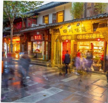
ถนนชอยกว้างแคบ