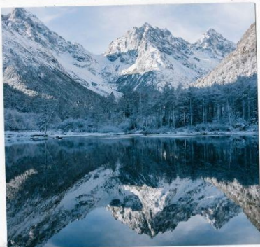
อุทยานปีเหมิงโกว