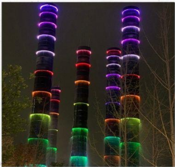
ชมแสงสีห้าง SKP