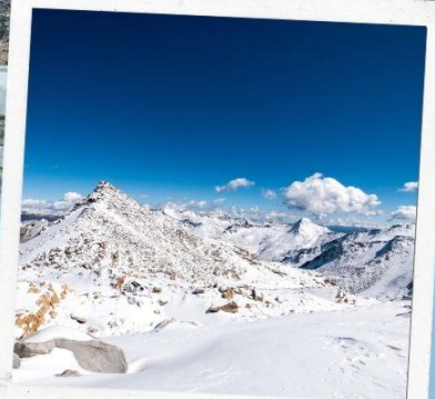
ภูเขาหิมะการ์เซีย ต่ำกู่ปิงชว่น