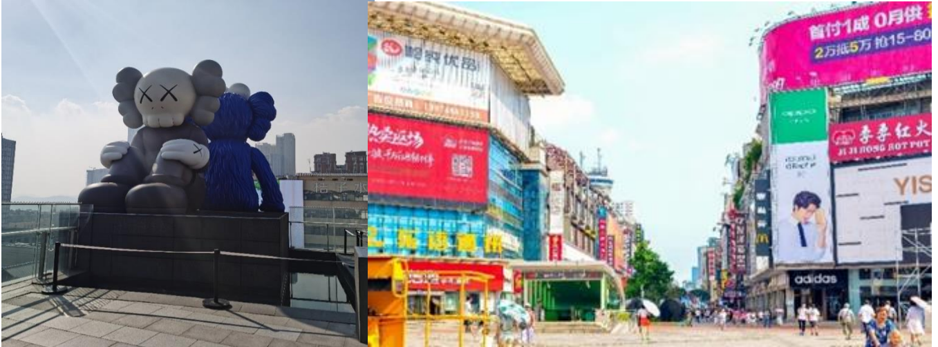
ประหลาดที่มีหัวเป็นกะโหลก ดวงตาเป็นรูปกากบาท (XX) และมีหูเป็นทรงกระดุกไขว้

ท่านอิสระ ช้อปปิ้งถนนคนเดินหวงซิงลู่ ตลาดใหญ่ที่สุดของมณฑลหูหนาน มีสินค้ามากมายให้ท่านเลือกซื้อทั้งสินค้าแบรนด์เนม ยี่ห้อจีนชื่อดังและสินค้าราคาถูก รวมถึงมีของกินพื้นเมืองให้ท่านเลือกสรร ให้ท่านซื้อของพื้นเมืองเป็นของฝาก และ ท่านสามารถพบตึก IFS เป็นจุดเช็คอินแห่งใหม่ ความพิเศษคือมีตึกตึก KAWS สองตัวนั่งหันหลังชนกันอยู่ด้านบนของอาคาร เป็นศิลปะที่มีชื่อเสียงระดับโลกจนใครหลายคนต้องมีไว้ในครอบครองคือ คอวส์ หรือตัวการ์ตูนหน้าตา