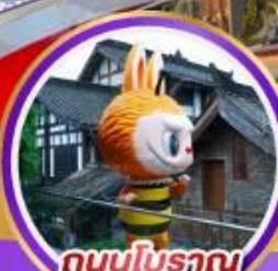
ถนนโบราณ ชอยกวางชอยแคบ