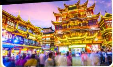
ตลาดร้อยปีเจียงหวงเมี่ยว