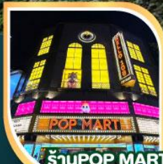
ร้าน POP MART ที่ใหญ่ที่สุดไต้หวัน