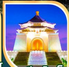
เจียงไคเช็ก