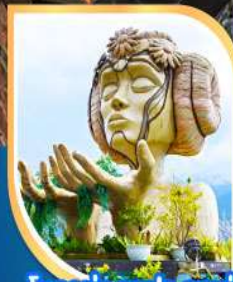
โมอานา ซาปา คาเฟ่