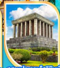
สุสานประธานโฮจิมินห์