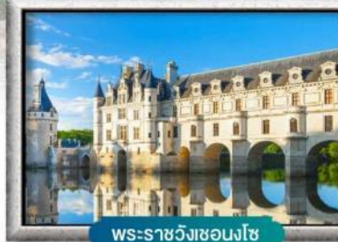
พระราชวังชองงโซ