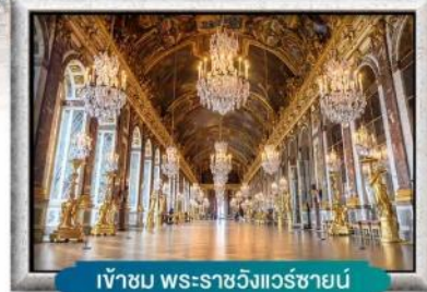
เข้าชม พระราชวังแวร์ซาย์