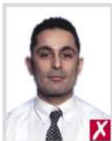
เอนเอียงไป