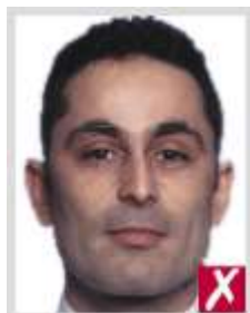
เอนเอียงไป