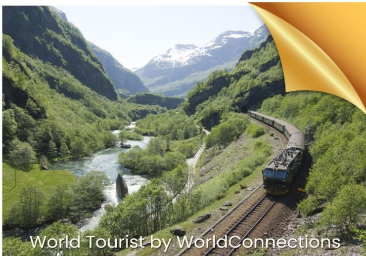
World Tourist by WorldConnections