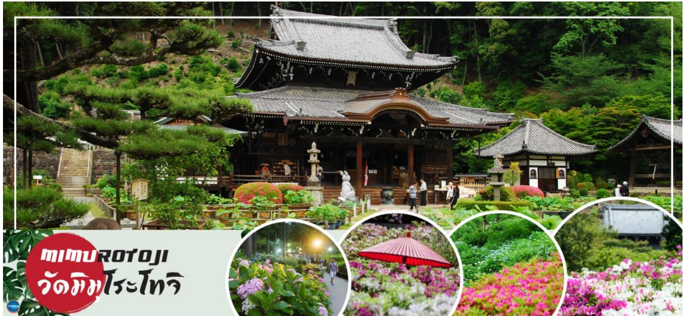
mimurotoji วัดมิมุโระโทจิ

01.15 น. เห็นฟ้าสู่ เมืองโอซาก้า ประเทศญี่ปุ่น โดยเที่ยวบินที่ XJ612