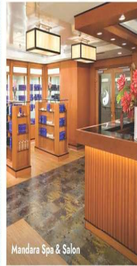
Mandara Spa & Salon