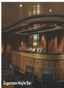
Sugarcane Mojito Bar

Spa & Salon, Fitness Center, Sports Court, 2 Swimming Pools, 4 Hot Tubs, Casino, Internet Café, Entourage Teen Club, Splash Academy Youth Center