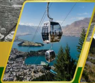
นั่งกระเช้ากอนโดล่า รับประทานอาหาร