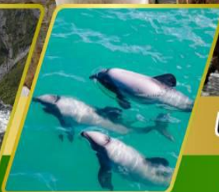
ล่องเรือชมโลมา