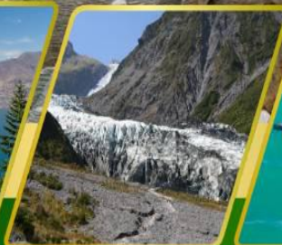
ธารน้ำแข็ง FOX GLACIER