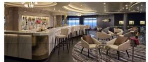
Magnum's Champagne Bar