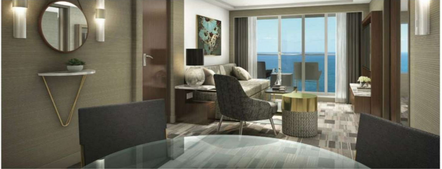
Penthouse with Large Balcony