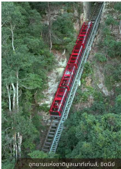
อุทยานแห่งชาติบลูเมาท์เทนส์, ซิดนีย์