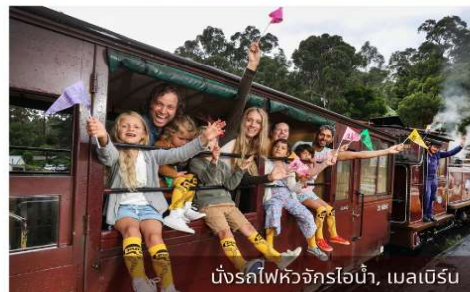
นั่งรถไฟหัวจักรไอน้ำ, เมลเบิร์น