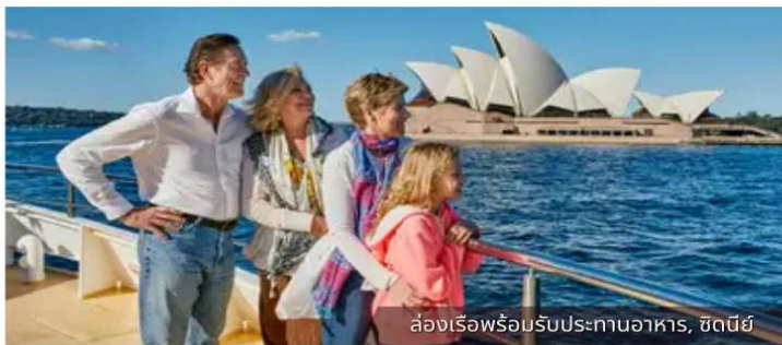
ล่องเรือพร้อมรับประทานอาหาร, ซิดนีย์