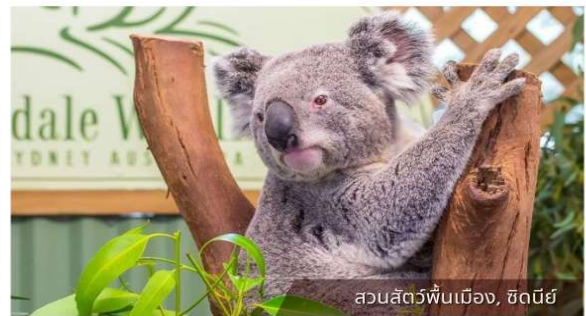
สวนสัตว์พินเมือง, ซิดนีย์