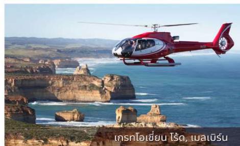
เที่ยวเฮลิคอปเตอร์, เมลเบิร์น