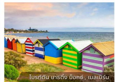
โบสถ์ต้น บาร์ติง น็อคซ์, เมลเบิร์น