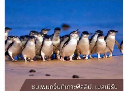
ชมเพนกวินที่เกาะฟิลลิป, เมลเบิร์น