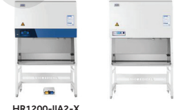
HR1200-IIA2-X HR1500-IIA2-X HR1800-IIA2-X