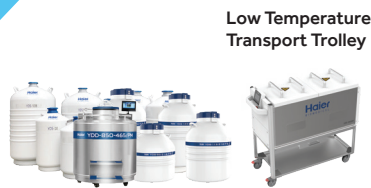
Low Temperature Transport Trolley